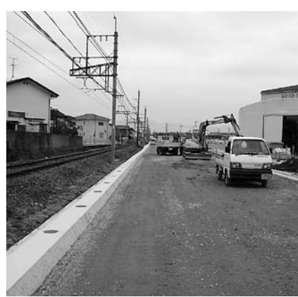
▲開通に向け、進められる工事