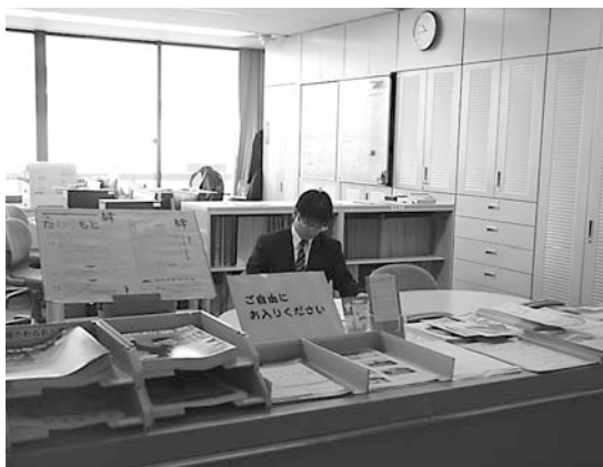
▲町役場2階の情報コーナー