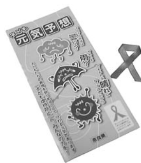
▲オレンジリボンと県の虐待防止パンフレット

子育てをしていれば誰でも、時にはイラ立ちやストレスを抱えてしまうものです。しかし、そんなところ