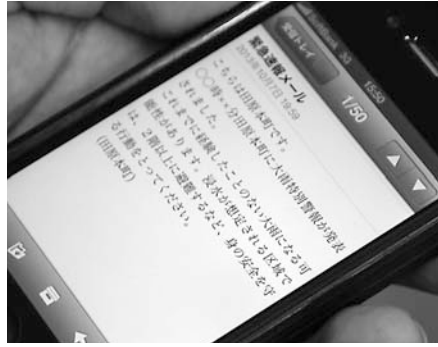
※これはイメージであり、実際に配信される内容とは異なる場合があります。