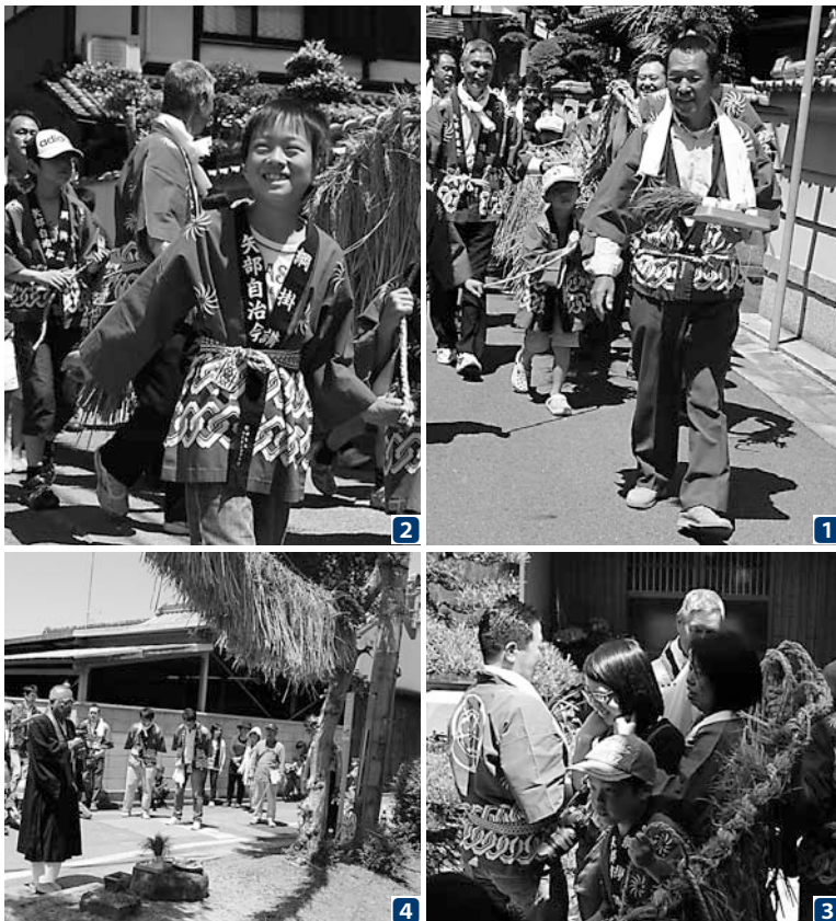
1 2 綱を担ぎ村中を練り歩く 3 道中、人々を綱で巻いて祝う 4 僧侶の読経で豊作と村の安全を祈る

矢部の綱かけは、米や麦が豊作で あるよう祈願する祭りで、江戸時代 から続いているといわれています。 5月5日、矢部公民館から、一同 は綱を担いで伊勢音頭に合わせて村 中を練り歩きました。道中、自治会 役員宅、昨年と来年の当屋宅などに 綱を持ち込んで祝い、家の人を綱で 巻いていきます。村を周回すると、