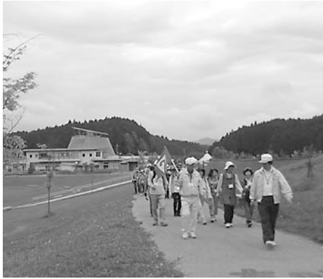
▲自然を満喫しながら歩く参加者

4月29日に「第95回歩こう会」が開催され、92人が参加しました。今回の歩こう会では、宇陀市かぎろひの丘万葉公園などを訪れ、約7キロを散策しました。宇陀路大宇陀道の駅を出発した参加者たちは、心の森総合福祉公園を通り、うだアニマルパークで昼食をとりました。その後、宇陀市松山重要伝統的建造物保存地区を訪れ、歴史ある町並みの散策を楽しみました。