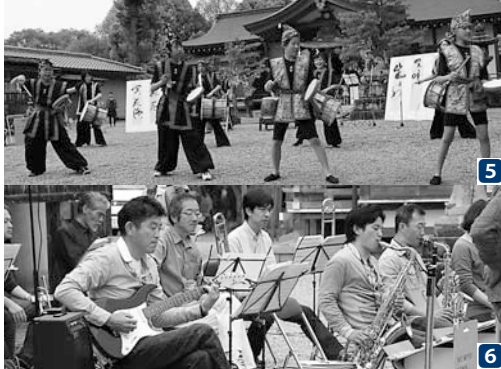
1 おもちまきに多くの人が集まる 2 3 4 書と音楽、朗読で演じられた「黄泉返り イザナギとイザナミ」 5 風流舞「奏楽」が会場を盛り上げる 6 ジャズ演奏で落ち着いた時間が流れる

4月19日、多神社で、春の例大祭「おおれんぞ」が行われました。 これは五穀豊穡を神に祈る春祭り で、主な行事は「おもちまき」。例 年多くの参拝者が、まかれたお餅を 取り合います。午前に神事が行われ、 午後には芸能奉納が演じられました。 芸能奉納は「勾玉天龍座」による 書と音楽・朗読の共演や、町観光協 会の風流舞「奏楽」による笛や太鼓 に合わせた舞、「銀音じゃず楽団」 による楽曲演奏が行われました。 当日は、芸能奉納を鑑賞する人で 賑わい、最後の行事「おもちまき」 でも盛大な盛り上がりを見せました。