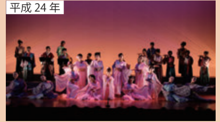
古事記1300年記念フォーラムを開催