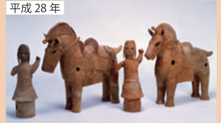
笹銚山2号墳出土品が県有形文化財に指定