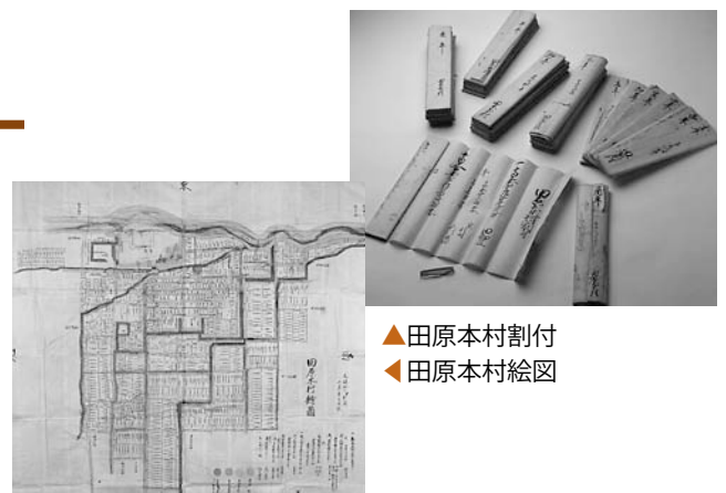
▲田原本村割付 ◀田原本村絵図