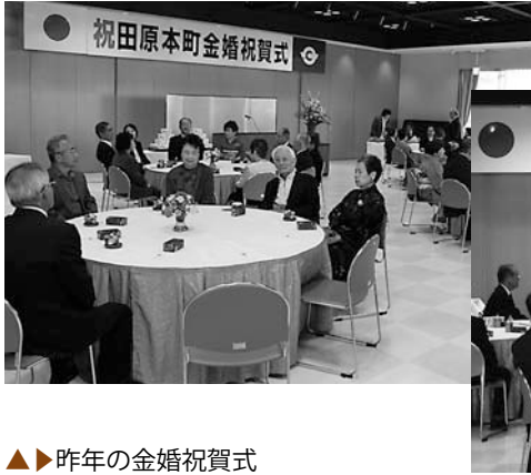
▲▶ 昨年の金婚祝賀式