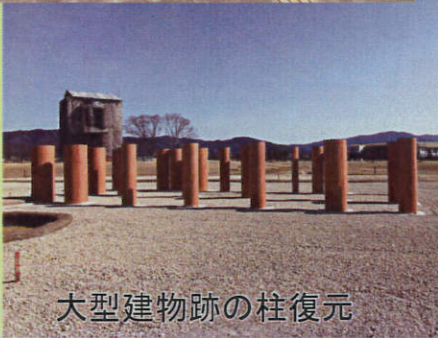
大型建物跡の柱復元