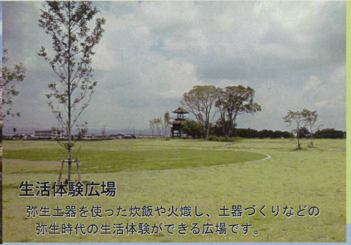
生活体験広場 弥生土器を使った炊飯や火熾し、土器づくりなどの弥生時代の生活体験ができる広場です。