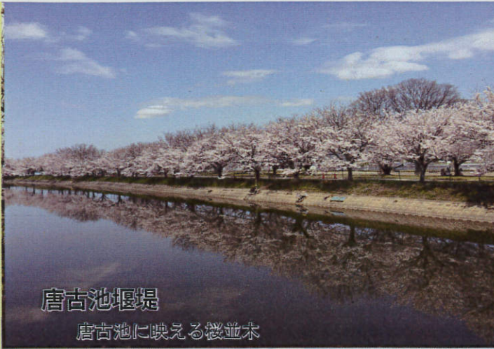
唐古池堰堤 唐古池に映える桜並木