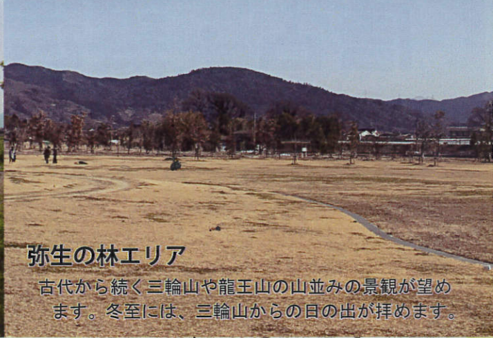
弥生の林エリア 古代から続く三輪山や龍王山の山並みの景観が望めます。冬至には、三輪山からの日の出が拝めます。