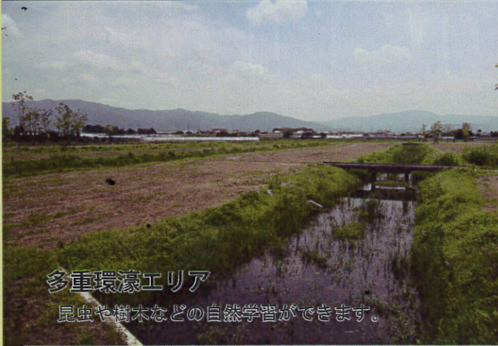
多重環濠エリア 昆虫や樹木などの自然学習ができます。