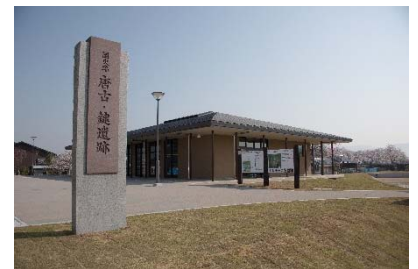
唐古・鍵遺跡史跡公園