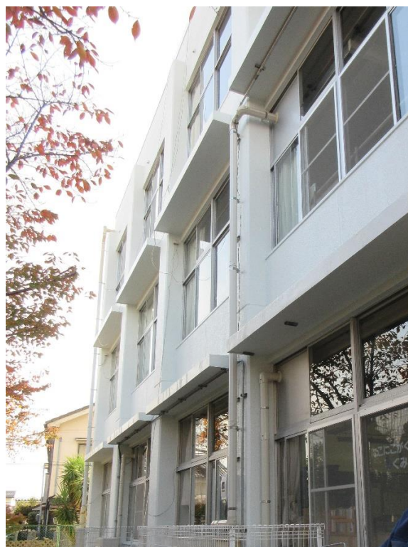
(校舎東面外壁：棟周囲のRC幕板・庇を撤去、外壁下地補修・塗装が完成しました。)