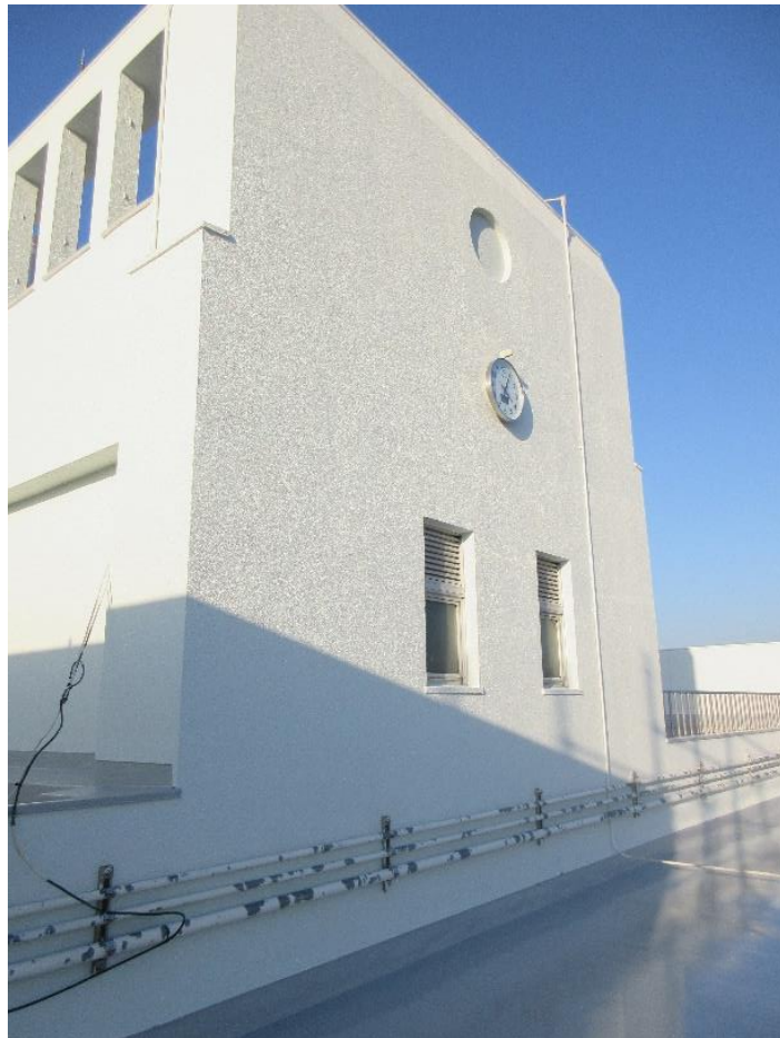
(屋上外壁：校舎同様、外壁下地補修・塗装が完成しました。)