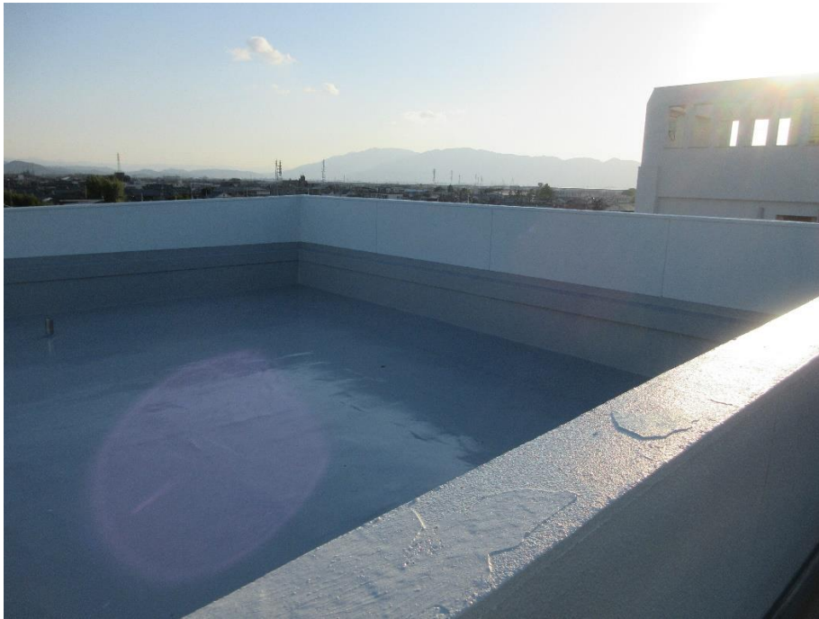
(屋上：外壁補修とあわせて防水工事も実施しました。)