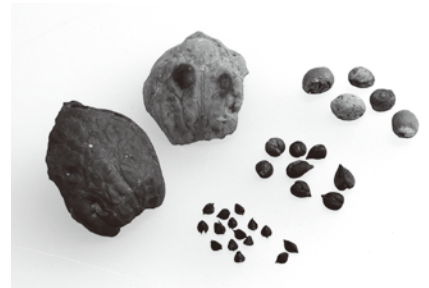
採集された植物の種子