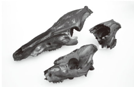
イノシシ類の頭骨