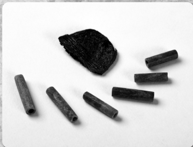
木棺墓内から出土した縦櫛と管玉(第24次調査)