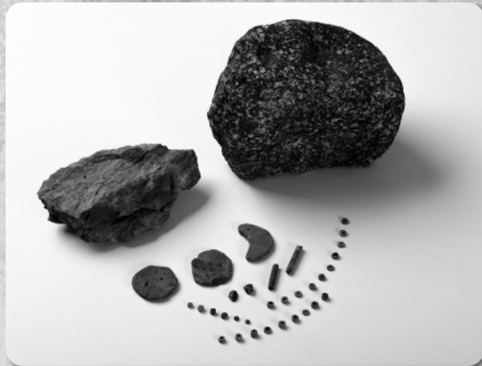
様々な玉類と台石(第39・41次調査)