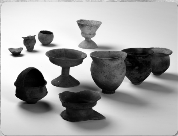
大溝から出土した土器(第39次調査)

弥生時代末～古墳時代の集落と玉作りに焦点を当て、その実態を周辺の玉作り遺跡を交えながら紹介します。