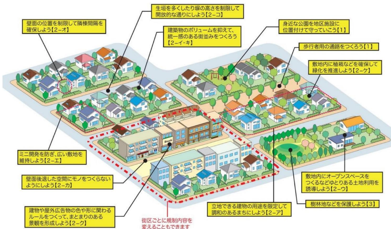
【 地区計画で定めるルールの例 】

市街化調整区域における地区計画制度は、市街化調整区域で行う開発・建築行為を適切に規制し、良好な都市環境の維持・形成を図るために創設された制度。