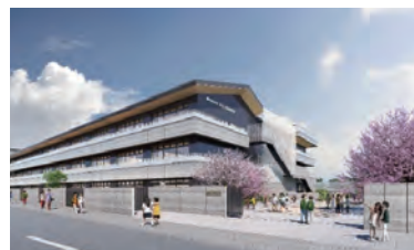
まほろば小学校 イメージ図