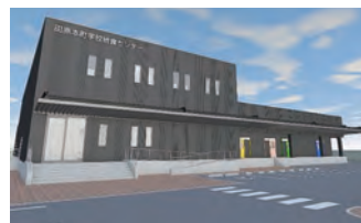
学校給食センター イメージ図