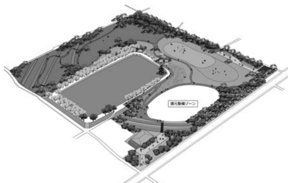
<唐古・鍵遺跡史跡公園完成予想図>