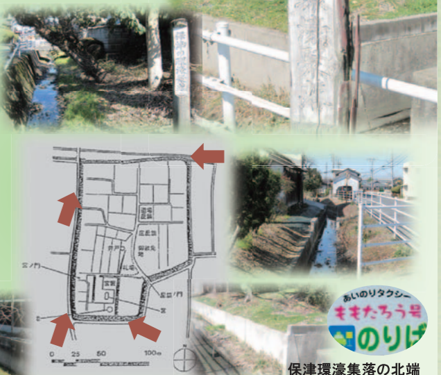
保津環濠集落の北端 保津公民館前

宮古池から南へ道を渡ると、保津の環濠集落があります。かつて、田原本町内には30の環濠集落が数えられたそうです。他の環濠集落がそうであったように、保津の環濠集落も外敵を防ぐ機能を備えたものでした。集落の周囲に濠幅約4mの水濠を巡らし、濠内の土壁には竹を植え、外から見透かされないようにしていました。元禄17年(1704年)の古絵図によれば、東西・南北約100m四方のほぼ正方形に近く、鏡作伊多神社部分が南側に張り出しています。