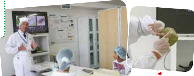
みざさの成り立ちや 柿の葉すしの説明を聞きます