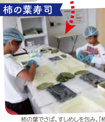
柿の葉でさば、すしめしを包み、「柿の葉すし」を作ります