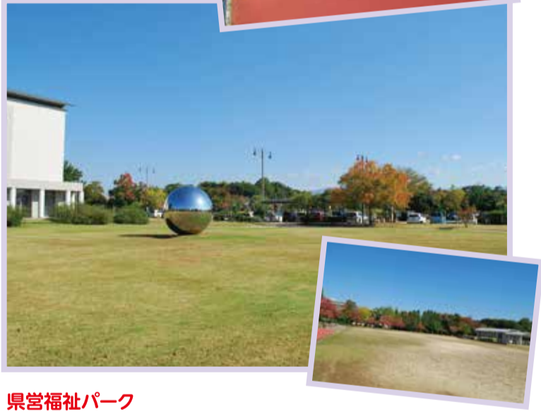
県営福祉パーク 町内南側にある飛鳥川沿いの公園で、広場中心の特徴的な球体のオブジェが目を引きま。

〈平日お昼のメニュー〉 きつねうどん+鮭ご飯ランチ 690円 唐揚げランチ(白ごはん付) 830円 カツ丼ランチ 830円 ちく天うどん+ミニカツ丼ランチ 930円 など