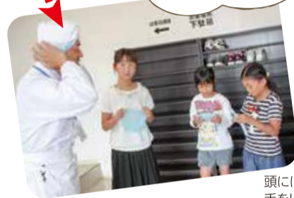
頭には紙のキャップをかぶり、 手をしっかり洗って衛生面OK!