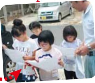
設計図を見ながら説明を受けます