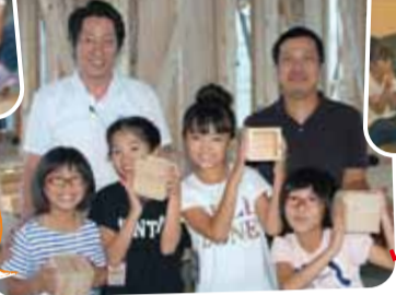
できあがったエンピツ立てを持って記念撮影