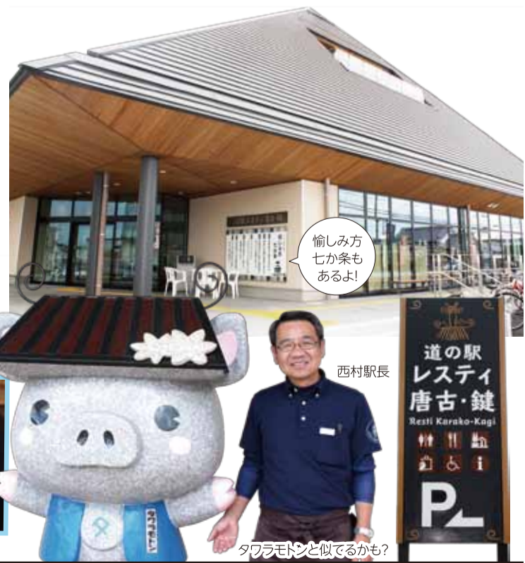
楽しみ方 七か案も あるよ!