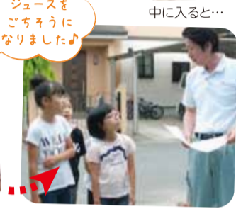
早速、近くの建築現場へ