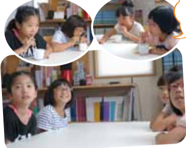
事務所にてまず自己紹介