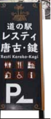
タワラモトと似てるかも?