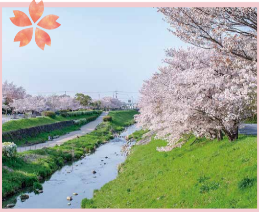
奈良県総合 リハビリテーションセンター (多)