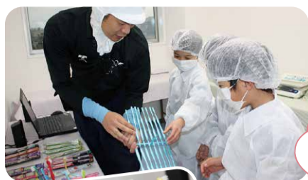
歯ブラシの説明を 受けて興味津々