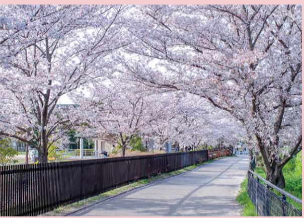
県営福祉パーク (多)