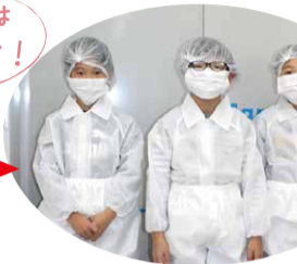
全身防護服とマスクに 着替えて工場へ。