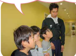
展示写真を見ながら、会社の説明を聞きました